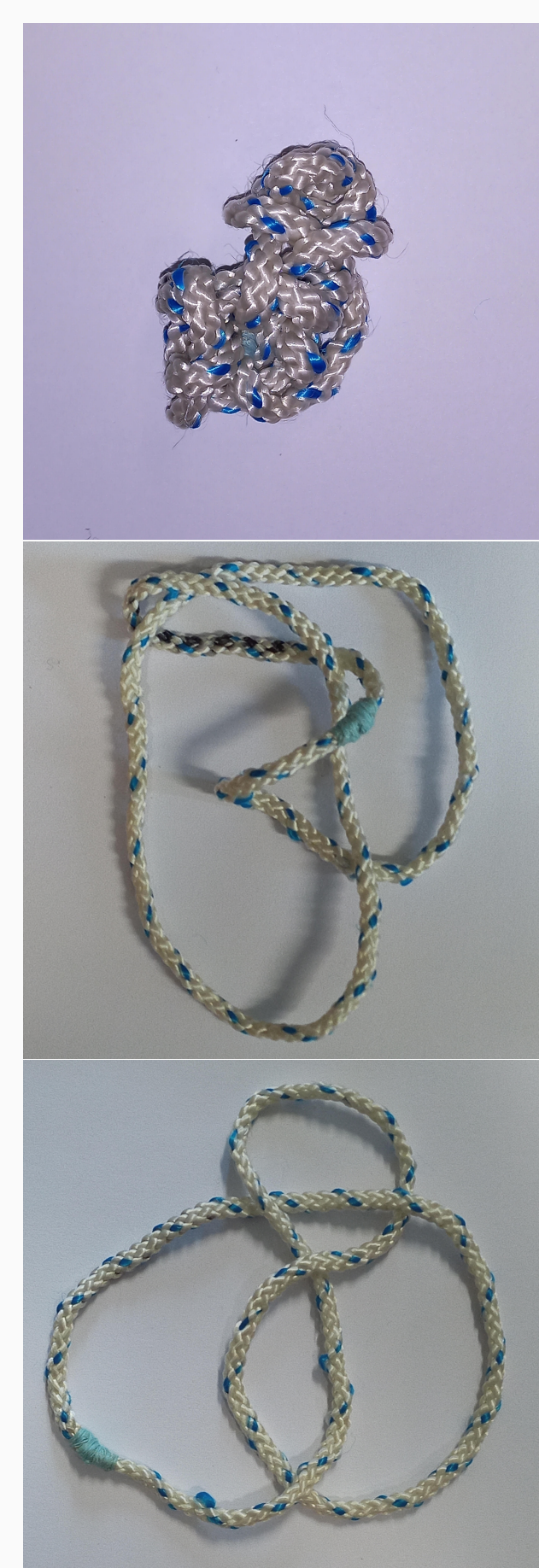
Le nœud 4 1 (miroir...)

Le but de cette séance est de faire manipuler au grand public des nœuds concrets, en introduisant des notions de classification, de représentation graphique, ou encore d'invariant (on y parle souvent de nombre minimal de croisements ). Chaque participant reçoit un nœud et une table des nœuds, et a pour mission d'identifier le nœud qui lui a été confié. En particulier avec des enfants, il est bon de préciser qu'ils ont le droit de toucher au nœud et de tirer sur les ficelles : beaucoup n'osent pas et tentent de résoudre le problème simplement en regardant leur nœud. Certains participants ayant hérité d'un nœud facile trouveront rapidement la réponse, et il peut être bon d'avoir plus de nœuds que de participants pour qu'ils aient une deuxième chance. D'autres auront besoin d'aide. Ça peut être un bon moment pour inciter à compter les croisements, à suivre un brin et regarder la succession de passages dessus/dessous, etc... pour faire une conjecture et tenter de mettre le nœud sous la forme correspondante. Nous finissons généralement la séance avec une vérification générale : si tout va bien, chaque nœud apparaît une et une seule fois.